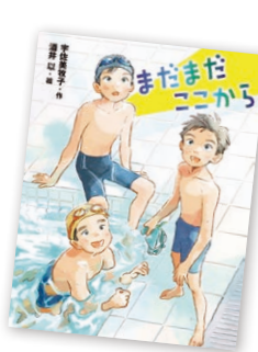
児童書 『まだまだここから』 宇佐美牧子/作 酒井以絵/絵 ポプラ社/刊