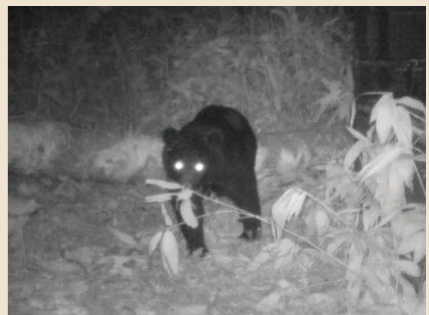
屋外用監視カメラに映ったクマの姿

地域を守る仲間を募集中！ 鳥獣被害対策には、地域の力が欠かせません。皆さんも狩猟免許の取得を検討してみませんか？ 岩手県での次の狩猟免許試験は10月4日(日)、申請受付期間は8月19日(水)～9月2日(水)です。詳細は農林課にお問い合わせください。