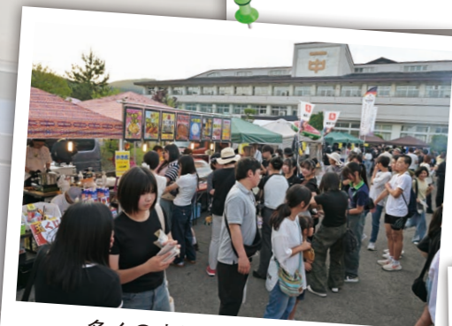
多くの来場者で大にぎわい