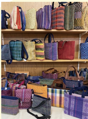
さまざまなデザインの裂織

手技芸館の展示販売スペースには多くの作品が並んでいます。天蚕織とマンダ織は一戸 つむぎ 紬まゆ玉会の皆さんが『繭玉を育てる』、『シナノキの繊維を取る(マンダ織に使用)』といった、素材を作る作業から作品制作までの全ての