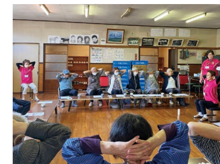
リラックスして体操をする参加者