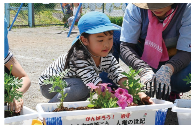
心を込めて花の苗を植えました

6月12日、じょうもんの里こども園年長クラス15人と一戸小学校4年生24人を対象に『人権教室』と『人権の花運動』が開催されました。人権擁護委員による講話や紙芝居などを通して、参加した子どもたちは他人を思いやる心や命の大切さについて学びました。人権教室終了後には人権擁護委員から花の苗が贈られ、子どもたちはプランターに丁寧に苗を植えました。