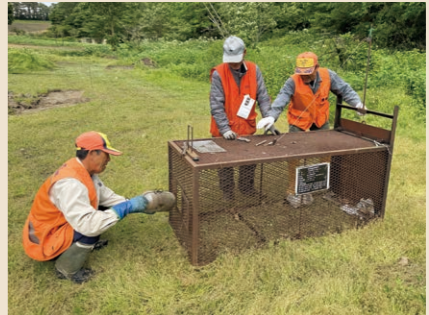
わなの設置にも免許が必要です

狩猟免許を取得した後は、毎年「狩猟者登録」を行う必要があります。狩猟者登録証と狩猟者記章の交付を受けることで、その年の猟期（11月～3月）に狩猟を行うことができます。 猟期以外に捕獲を行うには 農作物への被害を防ぐため、猟期以外にも有害鳥獣の捕獲が行われており、町では「鳥獣被害対策実施隊」が有害捕獲活動を実施しています。実施隊員は、対象鳥獣の捕獲だけでなく、被害状況の調査や生息状況の把握、捕獲技術の向上、被害防止対策の普及など、地域の鳥獣被害対策の担い手として活動しています。