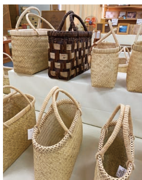
伝統の鳥越竹細工

作業を手掛けています。丁寧に仕上げられた作品はとても美しかったです。裂織は古くなった布を裂き、それに糸を織り込んでいきます。糸の色や古布の組み合わせによってデザインはさまざま。生地を織りあげてから作品になるまでには1カ月ほどかかるそうです。