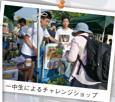
一中生によるチャレンジショップ