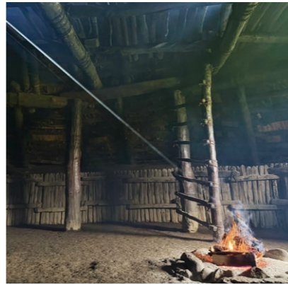
炉に火を焚く様子

2026年7月27日、御所野遺跡を含む『北海道・北東北の縄文遺跡群』は世界遺産登録5周年を迎えます。5年前の2021年は新型コロナウイルスの感染を警戒し、移動などを控える人が多い時期でした。それでも世界遺産登録が発表されると、岩手県内や青森県など比較的近隣から見学に訪れる人が増え、御所野遺跡について広く知っていただく機会となりました。