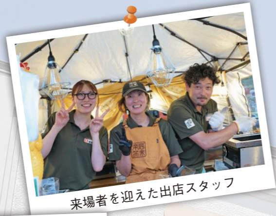
来場者を迎えた出店スタッフ