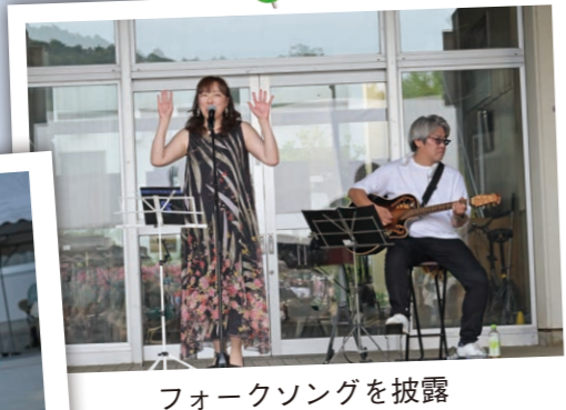
フォークソングを披露