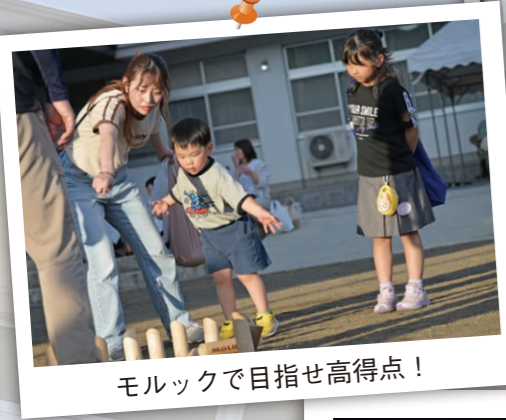
モルックで目指せ高得点!