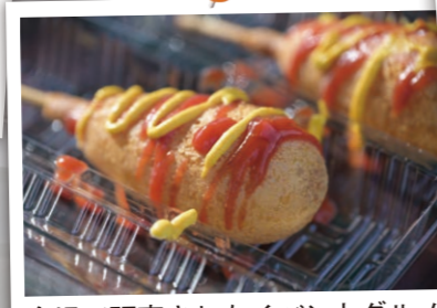
会場で販売されたイベントグルメ