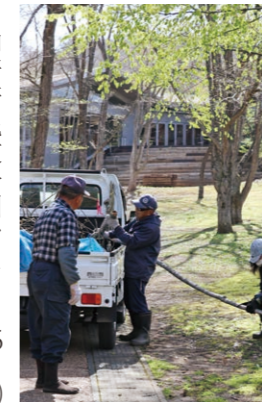
縄文公園を整備しています

文時代の生活に沿って、定期的に炉に火を焚いているためです。縄文人が今もここで暮らしているかのような光景です。 感謝の気持ちを込めて 遺跡公園を維持管理する現場の皆さん、公園や復元建物を掃除してくださるほっとワークのぞみの皆さん、遺跡ガイドの皆さん、建物の復元工事を行う大工さん、春と秋のクリーンデーに参加いただいている皆さん、『本格的な土器づくり』などの体験プログラムや『わくわく文化財セミナー』講師の皆さん、調査や奉仕活動などを行う町内小中学校、高等学校の皆さん。ここで挙げきれないほど多くの人に支えられ、学びの場であり憩いの場でもある御所野遺跡を一緒につくっています。