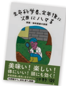
一般書 『生命科学者、定年後に畑にハマる』 仲野徹/著 幻冬舎/刊