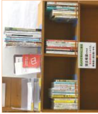
そよかぜ号のミニ貸出コーナー