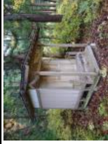
鳥海マップ No.84 回廊敷 八幡様

今後の主な行事予定 1月18日(水) ・西川目長寿大学校④ 「鳥海の郷土芸能」 時間 10:30～ 場所 鳥海地区センター