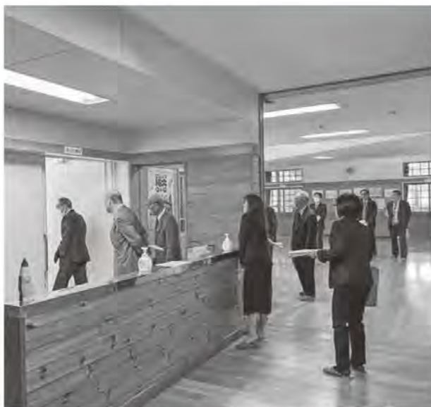
改修された施設を視察する議員