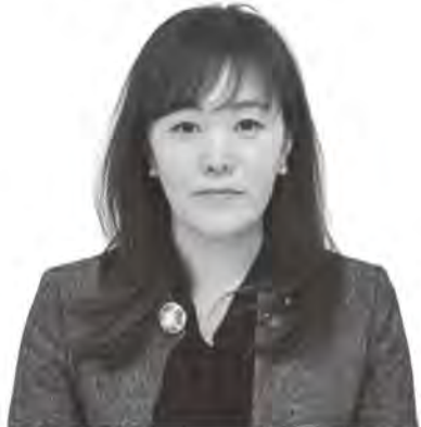
おおさわ えり こ 大澤恵里子 議員