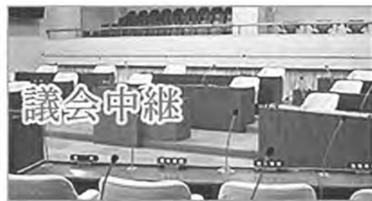
※町ホームページの町議会から入ります。

一般質問は、行財政全般にわたり疑問点をただし、町の所信を求めるもので、定例会で行います。質問は、議員と町長が対面し、一つの質問をして一つの回答を得る「一問一答方式」です。1人50分の制限時間内で質疑を繰り返します。