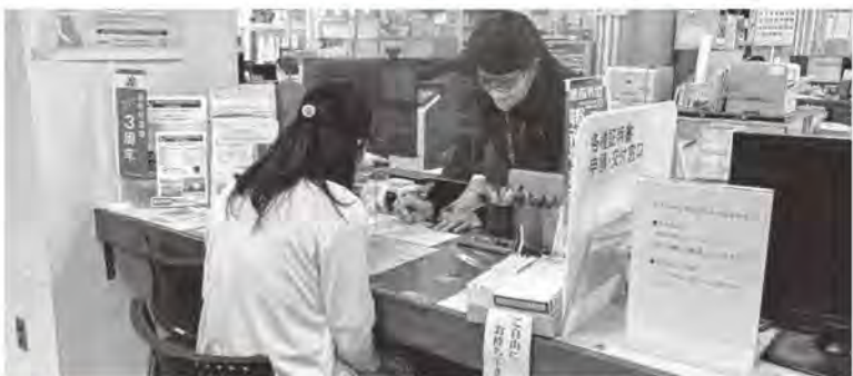
利便性の向上が求められる証明書交付