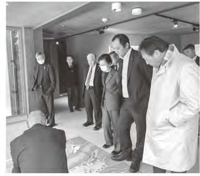
館内を視察する北秋田市議会議員

北秋田市議会から会派「清明会」の7人が来町し、御所野遺跡の取り組みについて視察されました。当町からは議長、世界遺産課職員、議会事務局職員が出席し、「御所野遺跡について」御所野縄文博物館や遺跡が身近に感じられる取り組みを説明しました。その後、ボランティアアガイドの養成や運営方法を変えたことに関して質疑があり、活発な意見交換がなされました。