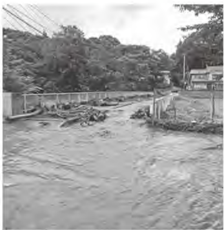
馬淵川が氾濫し被害を受けた西法寺地区

答 【地域整備課長】 建造物などで土地が固められていない場所について、今後1000平米以上の※2雨水浸透阻害行為を伴う開発をする場合は、県知事の許可を要します。