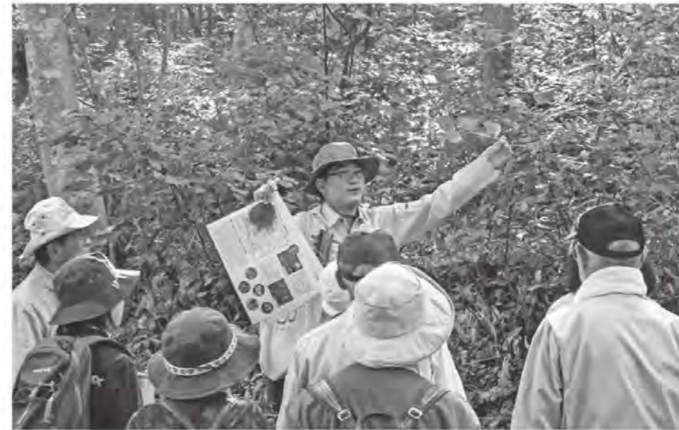
来場者に御所野縄文公園の植物を紹介する地域おこし協力隊員