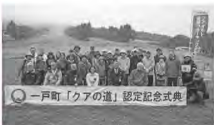
一戸町「クアの道」認定記念式典

延伸を図りたいと考えます。来春以降には、認知度向上のためにも機会を重ねて設けていきたいと考えます。