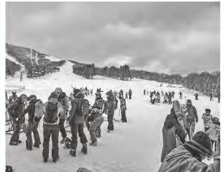
多くの利用客でにぎわう奥中山高原スキー場