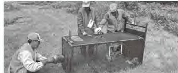
箱わなを設置する猟友会会員

問1 今シーズンの熊被害の発生件数、出没状況、被害内容について、町で把握している現状は。