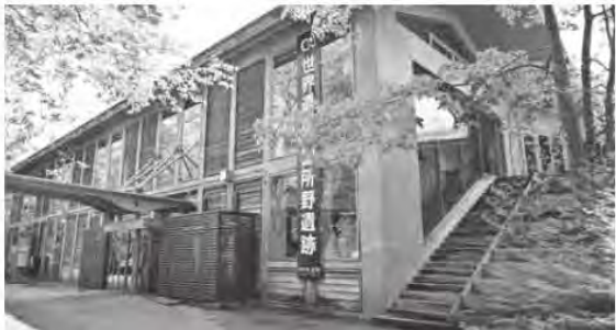
滞在環境の充実を図る御所野縄文博物館