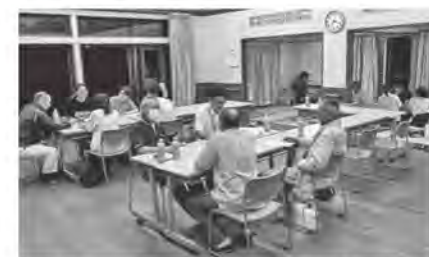
利活用について議論するワーキンググループ

外部連携の模索部会は、自分らしく過ごせる第三の場所としても活用できるよう、フリースペースや無人販売の設置について検討を進めています。また、夜市やクラフト市の開催など、イベント企画についても意見交換を進めています。