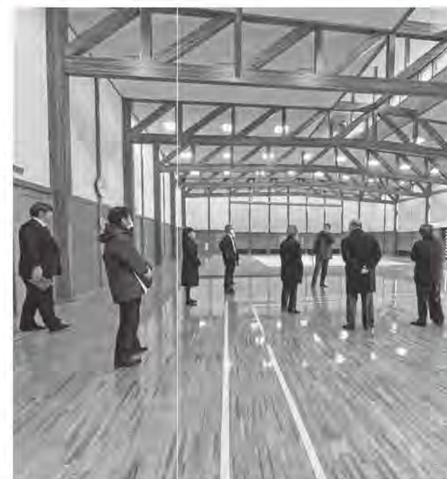
現地確認をする委員