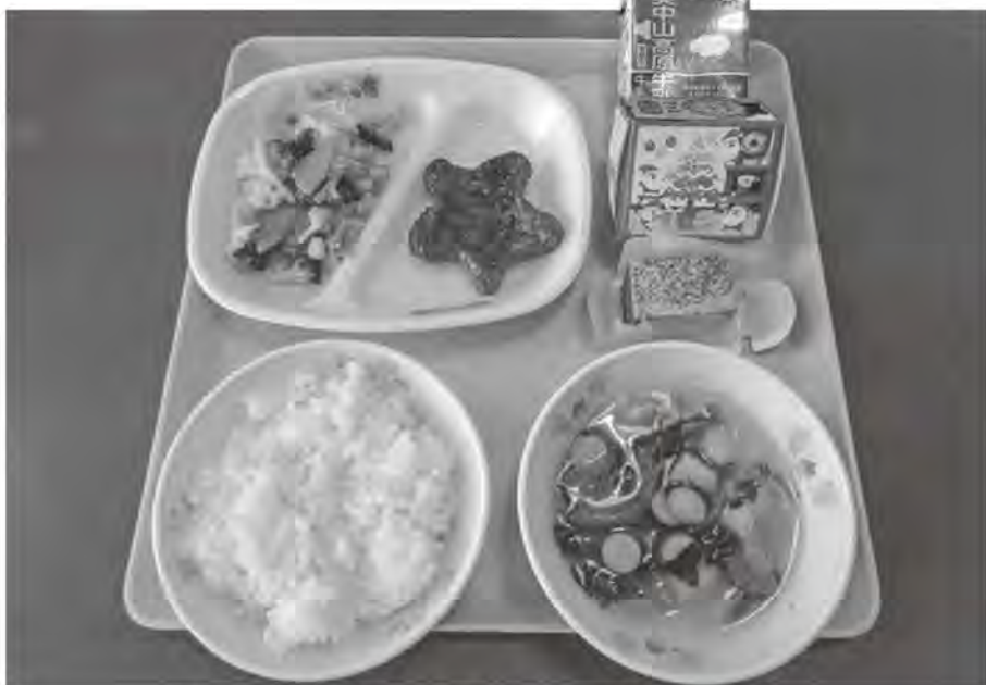
令和8年度の無償化を目指す学校給食

問 選挙時のマニフェストに「全ての町民が安全に安心して笑顔で暮らせる一戸町を目指して」とあり、7項目の政策が掲げられていましたが、特に重要と考える政策は何ですか。また、その財源はどのように措置するか伺います。