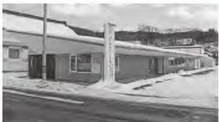
12月に閉院した小児科クリニック

答 【町長】医療機関として再開できるように努力していきたいと考えています。健診は、小児科クリニックで実施していた4か月、7か月、10か月、1歳児健診を県立