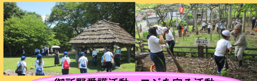
御所野愛護活動・フジを守る活動