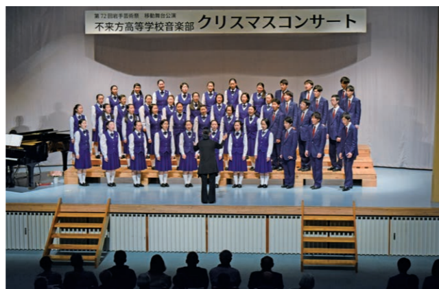
美しい歌声を披露する同校音楽部の生徒たち

御所野縄文公園讃歌では一戸混声合唱団まべちと一戸中学校特設合唱部の皆さんも一緒にステージへ上がって演奏しました。「大地讃頌」（追加曲）は近隣地域の合唱団の方も一緒にステージに立ちました。