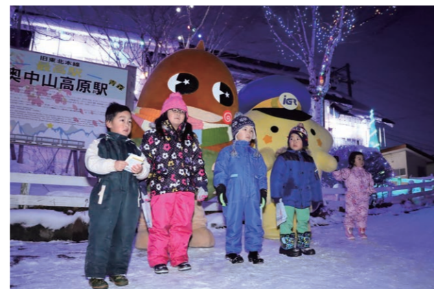
輝く駅舎前で記念撮影を行う地元の園児たち