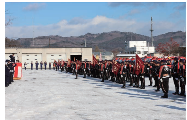
役場前駐車場で行われた式典の様子

一戸町消防団出初式が1月5日、役場前駐車場などで行われ、団員など消防関係者が、火災のない安全・安心なまちづくりに決意を新たにしました。八坂神社での安全祈願を終え、式には団員約250人、消防車両36台が参加。町、町議会などの関係者約20人が見守る中、無火災を誓いました。分列行進では沿道の町民に防火意識の高揚と火災予防を呼び掛けました。