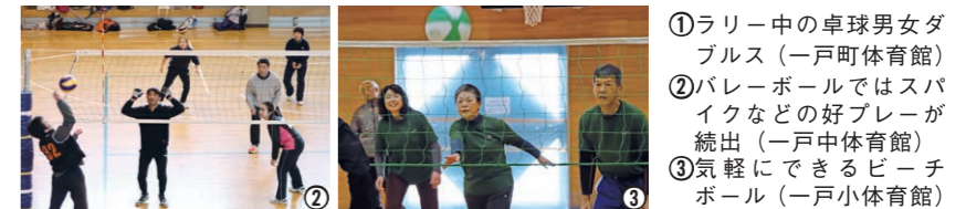
①ラリー中の卓球男女ダブルス(一戸町体育館) ②バレーボールではスパイクなどの好プレーが続出(一戸中体育館) ③気軽にできるビーチボール(一戸小体育館)