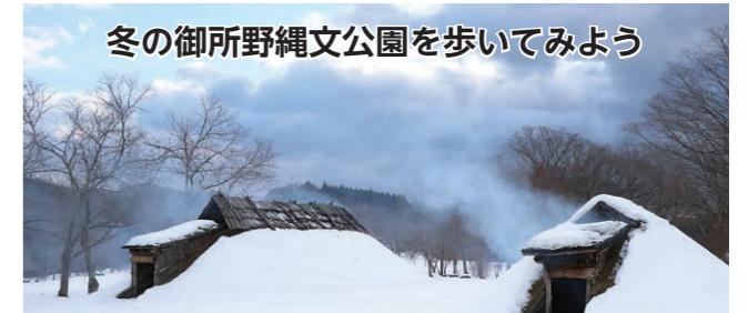
冬の御所野縄文公園を歩いてみよう

クロスカントリースキーやスノーシューをはいて、冬の縄文公園を散策してみませんか。白い雪原についたさまざまな動物の足跡や真っ赤な木の実など真冬の御所野でしか見られない景色を味わうことができます。