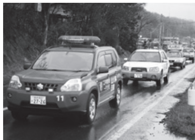
降りしきる雨の中で行われた山火事予防パレード。

参加者は消防車や広報車などに分かれて乗り込み、分署前を出発。町内を巡回して山火事防止を呼び掛けました。