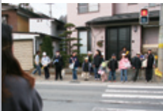
春には、保護者、先生、スクールガードが通学を見守ります。