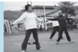
昨年のチャレンジデー。朝の役場前のラジオ体操ですっきり!!