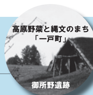
高原野菜と縄文のまち 「一戸町」