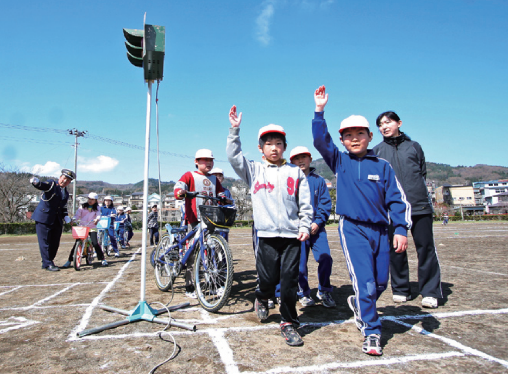
↑一戸小学校で行われた交通安全教室。さわやかな風が吹きぬける中、児童たちは安全への理解を深めた。