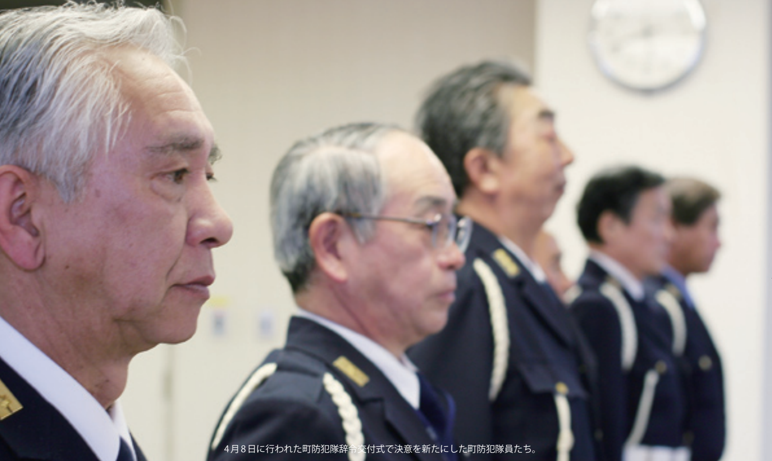
4月8日に行われた町防犯隊辞令交付式で決意を新たにした町防犯隊員たち。