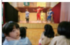
近未来警察カシオペア第3回公演が一戸幼稚園で1月28日に行われました。同幼稚園、楯山へき地保育所らの園児約40人が、防犯について楽しく学びました。