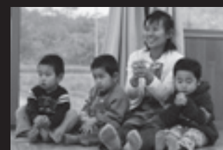
昨年のチャレンジデー。鳥越地区川原田平公民館での1こま。