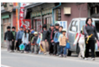
登校班では上級生が下級生の安全をしっかりと見届けています。

は笑顔で「お帰りのさい」と返事をしてくれ、とても良い気持ちになります。また、あいさつをすることによって地域の人たちに知ってもらい、守られているような感じがします。もしも、危険な目に遭つ