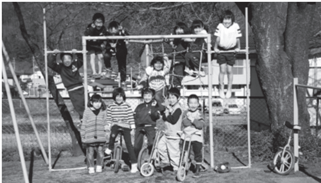
◎この春、学童クラブに入った1年生のお友達に小学校でがんばりたいことを聞きました