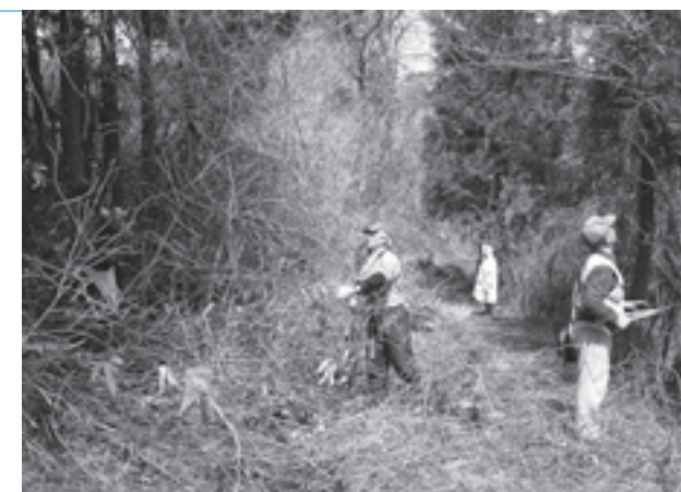
奥州街道白子坂の奉仕作業で約 300 ㍍の道がきれいに整備されました。

同日、町教育委員会では奥州街道で調査を行い、白子坂の近くで新しい建物跡を確認しました。