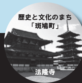
歴史と文化のまち 「斑鳩町」