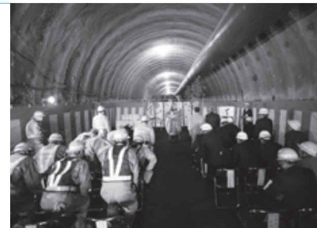
トンネル部分は 3 月から掘削を始め、約 120 ㍍掘り進んでいます。

鳥海線は、町総合運動公園と中里を結ぶ新町道で全長 1,305 ㍍、幅員 8 ㍍（車道 6.5 ㍍）。平成 23 年 4 月の道路供用開始を予定しています。