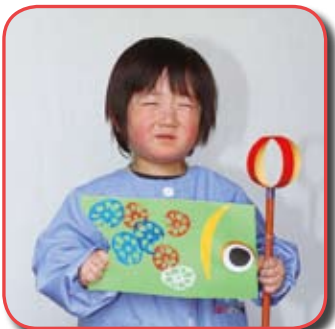
なしろはば しょうまくん