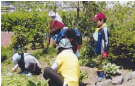
袋町町内会では自治会活動保険に加入し、花の丘公園の維持管理活動を行っています