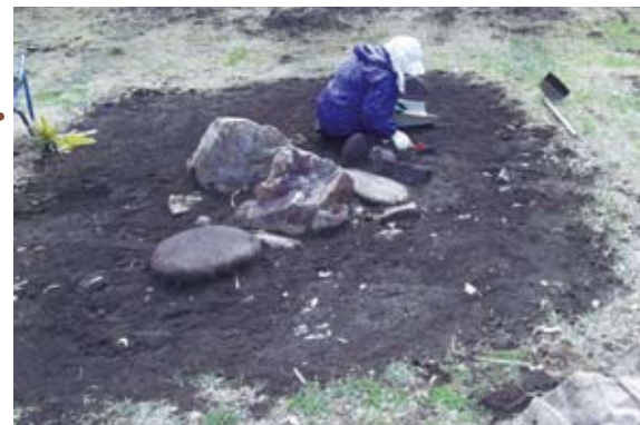
配石遺構での作業の様子

御所野縄文公園の中央に広がる配石遺構。縄文時代の人々によって、さまざまな形に並べられた立石や組石がサークル状に広がる遺構を、そのまま展示しています。 冬の間は、凍結や温度変化などによる遺構の劣化を防ぐため、土をかぶせて保護しています。 4月に入り、暖かくなってきたことから、かぶせていた土をとり、見学していただけるように準備を行いました。 公園へお越しの際は、配石遺構までぜひ足をお運びください！