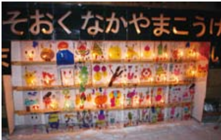
奥中山高原地域づくり振興会は子育て活動としてイルミネーションに取り組みました