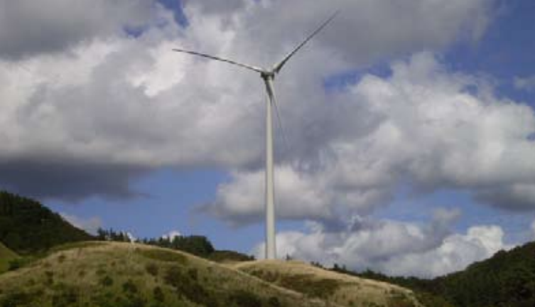
(上) 高森高原に建設される風車のイメージ写真 (左下) 祈願祭で行われた神事(右下) 皆で祈る無事故・無災害