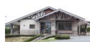
○奥中山高原歯科クリニック 奥中山字西田子 1311 ☎ 35-2591 〈休診〉 木曜・日曜・祝日

城院長は「将来的には、訪問ケアも大学などの協力を得て行っていきたい。治療よりも口腔ケアを重視し、虫歯のない地域を目指したい」と決意を新たにしました。