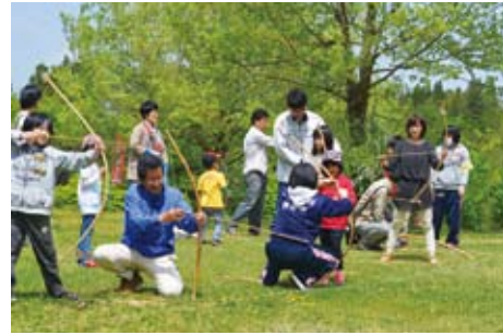
弓矢体験の様子(平成27年イベント時)