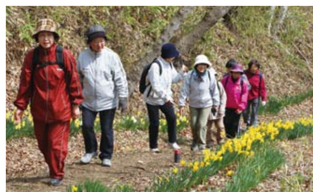
スイセンロード・ウォーキングを楽しむ参加者たち

諏訪野地区住民による「スイセンロード・ウォーキング」が行われ、約10人が春の訪れを楽しみました。