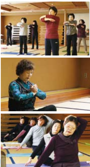
▲ヨーガに取り組んでいる様子