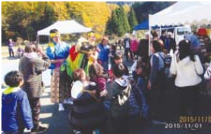
小友自治公民館では、地域交流を目的に公民館まつりを実施しました