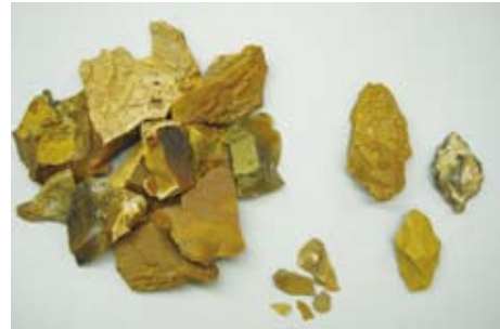
材料となった珪化木④と矢じりの作成途中

「縄文まつり 縄文の火―御所野から感動・感謝」が5月3日、御所野縄文公園で開催されました。会場で行われた縄文体験のひとつ、弓矢体験も多く来場者でにぎわいました。 弓矢は、縄文時代に入ってから新たに使用されるようになった狩猟具のひとつです。 昨年12月に刊行した総括報告書の作成に向けた最新の研究により、御所野遺跡の矢じりづくりについて、さらに詳しい内容が明らかになってきました。