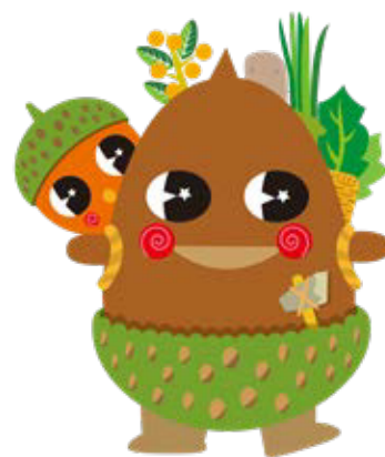
ごしょどん、ごしょたん