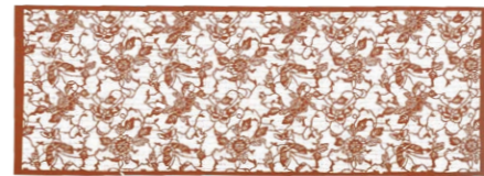
『菊に蝶』（彫刻面 35.2 センチメートル ×12.4 センチメートル ）／浪岡家

染めの型紙は、着物の布に模様を染める際に用いられるものです。染め物といえば京都府の京友禅、染めの型紙といえば三重県鈴鹿市の伊勢型紙などが有名ですが、一戸でも型紙を用いて染められた着物が作られていた歴史があります。 浪岡家に残る古文書から、江戸時代の中頃、一戸には紺屋が6件あったことがわかっています。そのなかで、浪岡家を使用していた染めの型紙のみ、現在まで残されており、平成2年11月、保存状態が良い740枚が町有形民俗文化財に指定されています。 浪岡家は代々『コヤド（紺屋殿）』という屋号で呼ばれており、文久元年（1861）年の一戸秋葉三社再建の際には、浪岡家からのぼり2枚を寄進していることなどから、江戸時代には染物屋を営んでいたことは明らかです。 浪岡家の型紙には販売元や産地を示す商印280点が確認されており、その内訳は伊勢白子