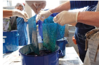
藍染めカレンダーづくり体験

193点、京都61点、江戸11点、会津喜多方5点、盛岡2点、不明8点となり、7割以上が伊勢白子からもたらされた伊勢型紙であることが分かっています。 これらは、型紙の流通経路や当時の交易の状況を示すものであり、江戸時代、一戸が奥州街道の宿場町として発展し、華やかな模様の着物を着る人がいたことを物語る貴重な資料です。 現在、御所野縄文博物館では、藍染めカレンダーづくりなどの染めや染めの型紙に関する体験を行っています。また、11月22日から博物館2階郷土資料コーナーにて、型紙の展示を行っています。