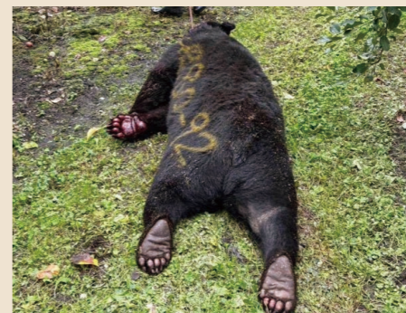
10月に楢山地区で捕獲されたツキノワグマ

本年度の町内の野生鳥獣による農林被害報告件数は18件で、昨年度に並んでいます。また、令和5年度は29件の報告があり、毎年被害に悩まされ続けている状況です。本年度の一戸町鳥獣被害対策実施隊による有害鳥獣捕獲の実績はツキノワグマ6頭、イノシシ33頭、ニホンジカ50頭でした。