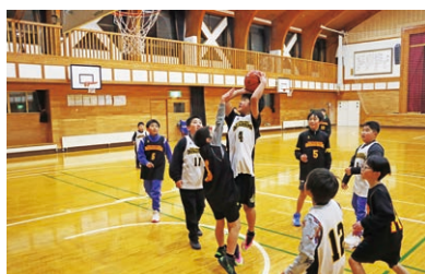
ブロックを避け、シュートを狙う団員