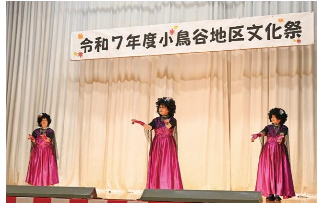
小鳥谷婦人会によるステージ発表

小鳥谷地区文化祭が11月15日と16日の2日間、小鳥谷地区センターで開催され、小鳥谷ふじの花こども園や文化芸術団体などの作品が多数展示されました。16日には地元産品の販売や、郷土芸能、なぎなたなどのステージ発表も行われ、来場者からは「どの団体の発表も素晴らしい」との声が聞かれるなど、会場は終始温かな雰囲気に包まれていました。