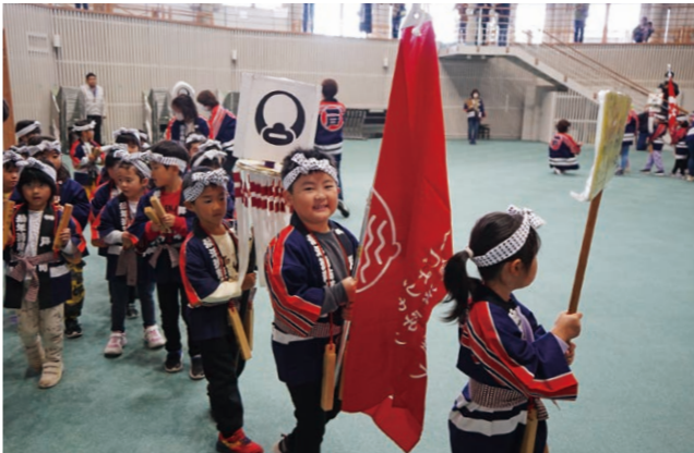
火の用心を呼び掛けながら行進する園児たち

秋の全国火災予防週間の11月11日、園児による防火パレードが行われました。本年度はクマの出没が相次いだことに伴い、町コミュニティセンターで開催。参加したいちのへじょうもんの里こども園、小鳥谷ふじの花こども園、奥中山みどりの森こども園の幼年消防クラブの園児119人は拍子木の音を響かせながら、元気いっぱいに火の用心を呼び掛けました。