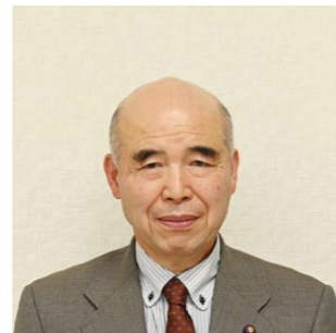
仁昌寺 泰夫 (71) ①3 ②小鳥谷仁昌寺