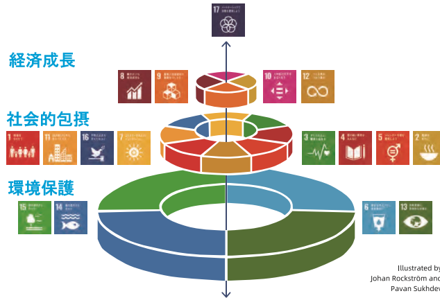
Illustrated by Johan Rockström and Pavan Sukhdev

この図は SDGs ウェディングケーキモデルと言います。一番下に基盤である地球環境、その上に私たちの社会、さらにその上にはお金を生み出すための経済があります。SDGs の目標は密接につながっていて、目標達成のために世界全体の人々の協力が不可欠です。